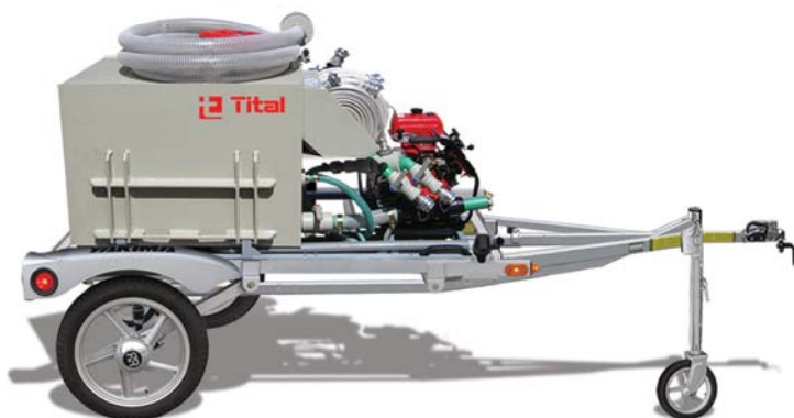
Вариант на полуприцепе

Оборудован пожарной мотопомпой Tohatsu (Япония)