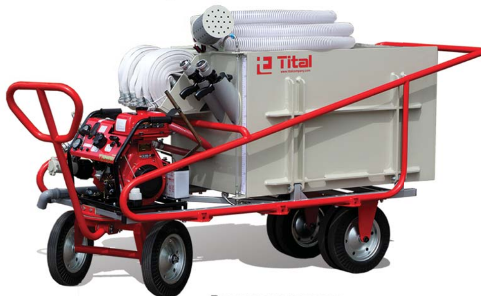
Вариант на тележке

Стартер электрический от аккумулятора и ручной